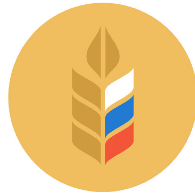
Министерство сельского хозяйства Российской Федерации