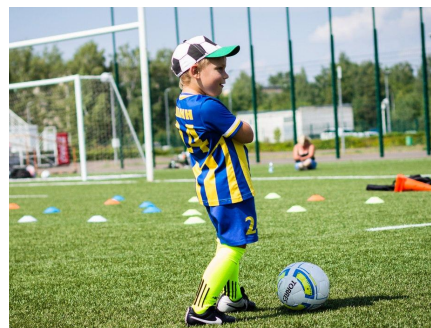
Детский футбольный клуб “Чемпион”

“Благодаря «Бизнес классу» удалось сформировать стратегическое видение направлений дальнейшего развития бизнеса, делегировать задачи и выстроить командную работу, разработать и внедрить новую стратегию продаж. Количество магазинов сети выросло почти в 5 раз, начали открывать точки продаж в СНГ. Выручка выросла в 4 раза, а средний чек увеличился на 18% по сравнению с маем 2016 года.”